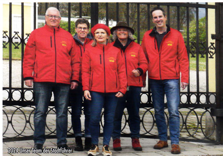
2024 Unser Team der Stadtführer