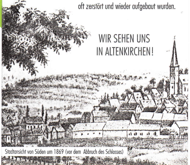
Stadtansicht von Süden um 1869 (vor dem Abbruch des Schlosses)