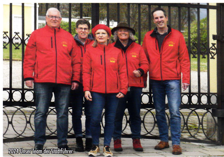
2024 Unser Team der Stadtführer